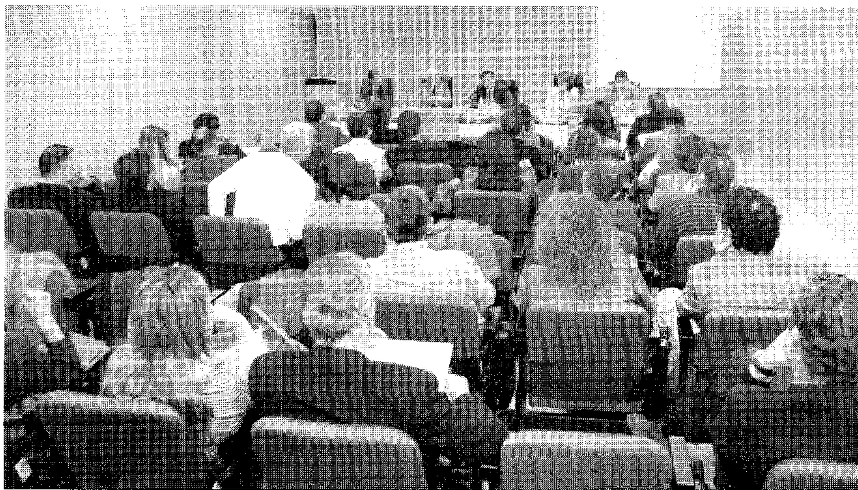
El seminario transfronterizo está destinado a profesores, alumnos, empresarios y profesionales del sector.